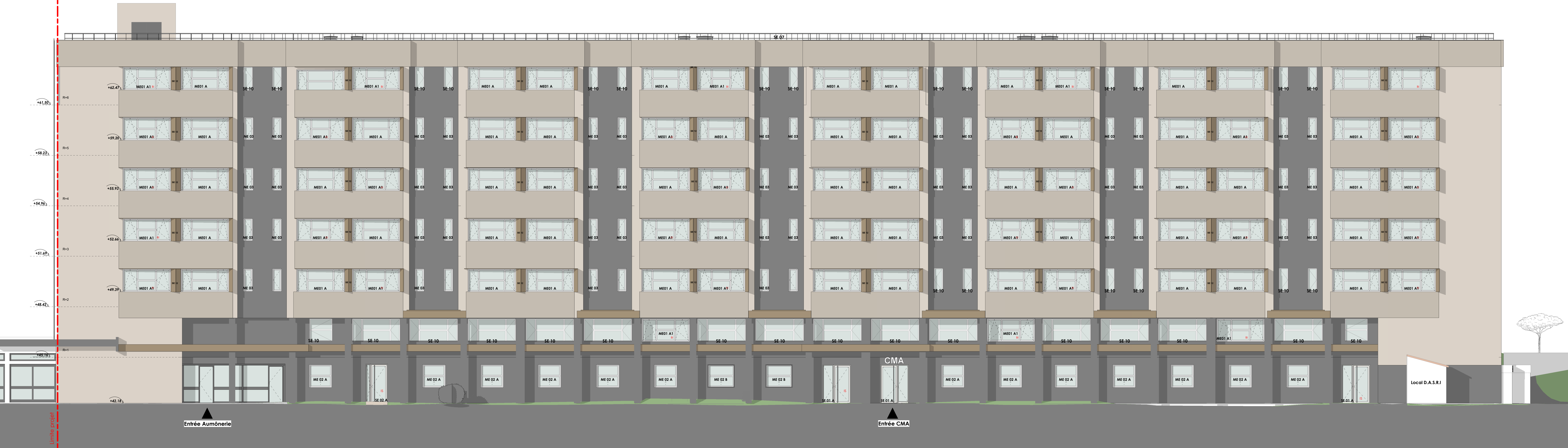
Elévation Sud_APD PRO