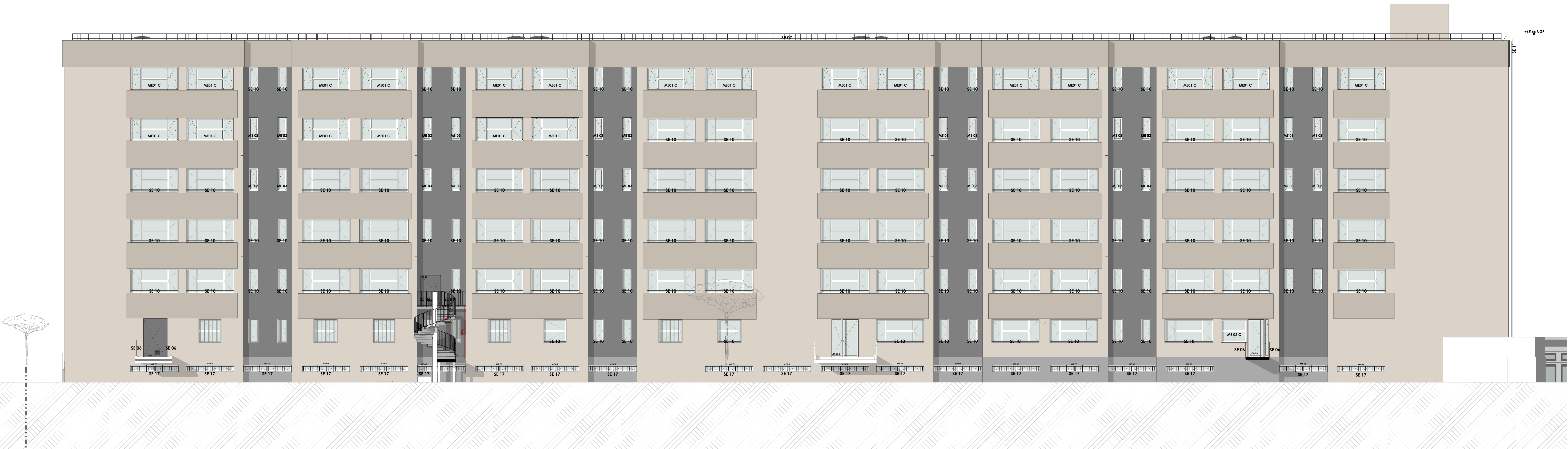
Elévation Nord_APD PRO